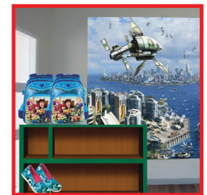
Custom Print (Wallpaper & Kijang Lux)

SUPPORT TEKNIS (Bebas Pulsa) 0800 1335 577 Head Office : Jalan Pahlawan Seribu Ruko Golden Boulevard Blok R no 21 BSD City, 15321 Tangerang, Banten, Indonesia Telpon : (62 21) 5316 1450 (Hunting)