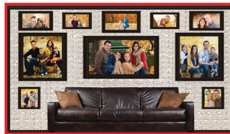
High Quality Photo & Canvas