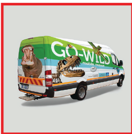
Mobile Branding (Stiker)