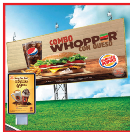
Spanduk & Neon Box (Flexy & Backlite)