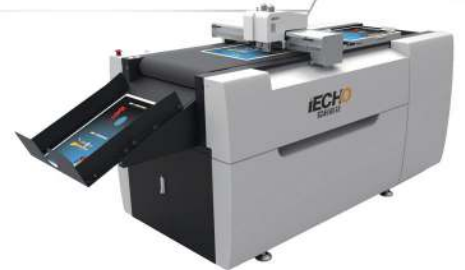
iECHO seri PK & PK Plus

Sambut iECHO , mesin cutting cerdas yang bisa potong hasil cetak, packaging, label, sampai roll. Mulai dari cetakan printer laser, offset, sampai bahan corrugated dan magnetic sticker yang tebal pun bisa dipotong dengan mudah. Enaknya lagi, iECHO dilengkapi berbagai fitur yang menjalankan mesin tanpa perlu ditunggu. Satu mesin memudahkan hidup Anda, juga berikan keuntungan, mau?