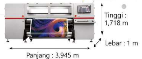
• HOMER 1800R PRO

Kini hadir, seri terbaru dari printer sublimasi industrial, HOMER 1800R PRO ! Dilengkapi print head Kyocera dengan opsi satu atau dua channel, Anda bisa memilih sampai 8 warna dengan opsi yang bisa disesuaikan. Dengan kecepatan sampai 445 m/jam, transfer paper 31 gram/m 2 , dan roll sampai 10.000 meter, kapasitas Anda akan jauh lebih maksimal dari saat ini!