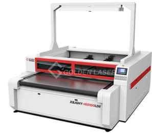
Tipe : AKARA PREMIUM

Informasi benar pada saat dicetak. Dicetak Juni 2020.