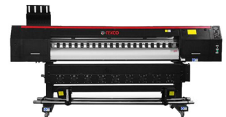
Texco Avalone 1802