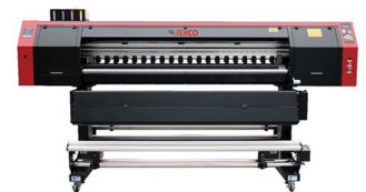
Texco Avalone 1803

©2020 hak cipta adalah milik Laysander Technology, PT. Tidak boleh menduplikat sebagian maupun seluruhnya tanpa izin. Laysander merupakan merek terdaftar milik Laysander Technology, PT. Semua nama produk dan nama usaha lainnya dipergunakan untuk tujuan identifikasi saja. Semua merek / merek terdaftar merupakan milik masing - masing pemilik merek. Laysander melepaskan semua tanggung jawab atas merek tersebut. Contoh hasil print merupakan simulasi. Aktual desain produk dan isi bisa berbeda. Spesifikasi dapat berubah tanpa pemberitahuan terlebih dahulu. Mohon untuk cek dengan konsultan terkait untuk informasi lanjut.