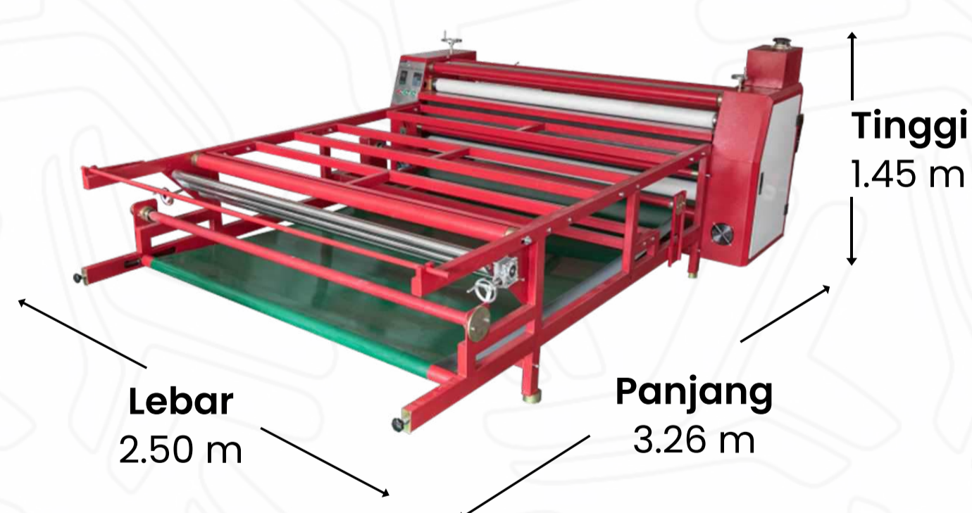
Ukuran Mesin Heat Press Roll ZH1932